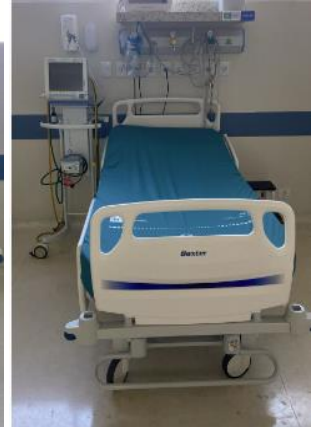
Leito 08 Pt. 1372023