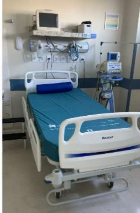
Leito 06 Pt. 1352023