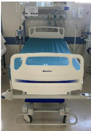
Leito 09 Pt. 1382023