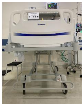
Leito 02 Pt. 1312023