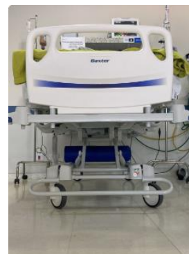
Leito 03 Pt. 1322023