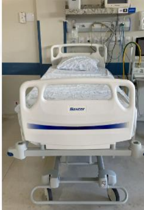
Leito 05 Pt. 1342023