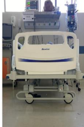
Leito 07 Pt. 1362023