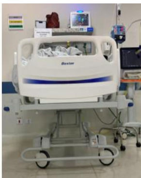
Leito 01 Pt. 1302023